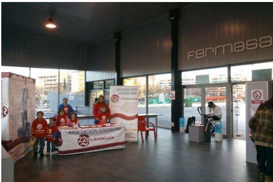
Venta de papeletas en la Feria de Muestras de Amilla "Fermasa" coincidiendo con "Juveandalus".